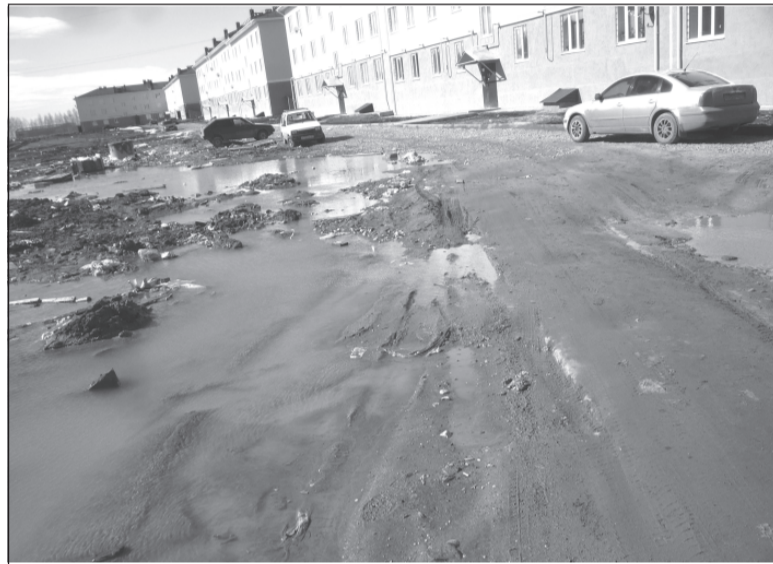
Новосёлы, получившие новые квартиры, с нетерпением ждут благоустройства придомовых территорий.

ем данного документа, и назвала примерную его стоимость. Однако, к сведению граждан, желающих попасть в программу переселения из ветхого жилья, ведущая приёма сказала о том, что она уже закончена и будет ли у неё продолжение, пока не ясно.