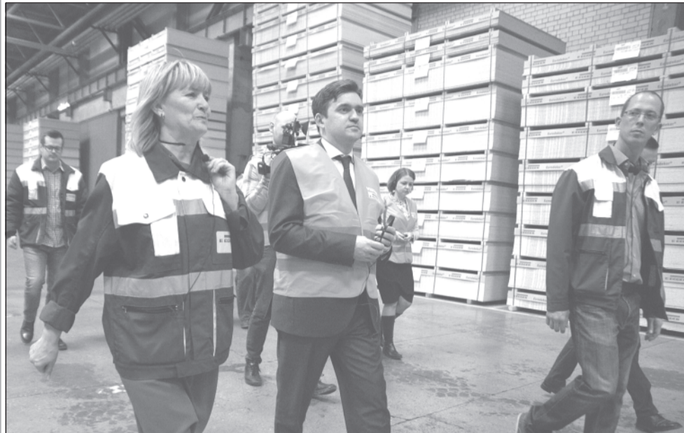
Станислав Воскресенский ознакомился с производством предприятия «Эггер Древпродукт Шуя».

Подписано Соглашение между правительством Ивановской области и компанией «Эггер Древпродукт Шуя», касающееся участия компании в развитии проектов социального и культурного значения в регионе.