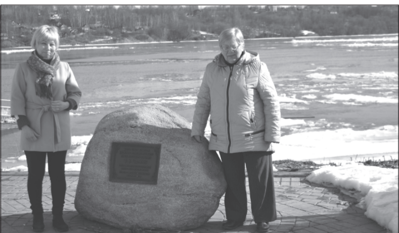
Память не уносит время.

Имя великого русского певца Ф.И.Шалапина в последнее время звучит на приволжской земле достаточно часто. Связано это и с тем, что в Плесе учреждён фестиваль его имени, и с тем, что на набережной Волги появился памятный знак, надпись на котором гласит о том, что на этом месте в скором времени будет установлен памятник выдающемуся русскому певцу.