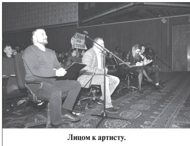
Лицом к артисту.

ствие: одна из юных исполнительниц, девочка из Плёса, прекрасно спела свою песню, чисто, проникновенно и грамотно, и сама выглядела, как настоящая принцесса, но её по какой-то причине ни один из наставников не выбрал. Повернувшись к ней лицом, наши судьи сами расстроились, что не пригласили её в свои команды, а девочка была более, чем достойная. «Мы