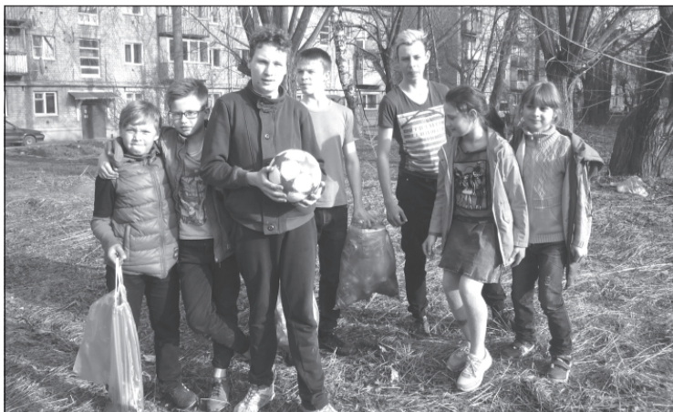
Эти ребята славно потрудились, очистив спортплощадку на ул. Фрунзе от залежей мусора и теперь могут играть в футбол с чистой совестью.