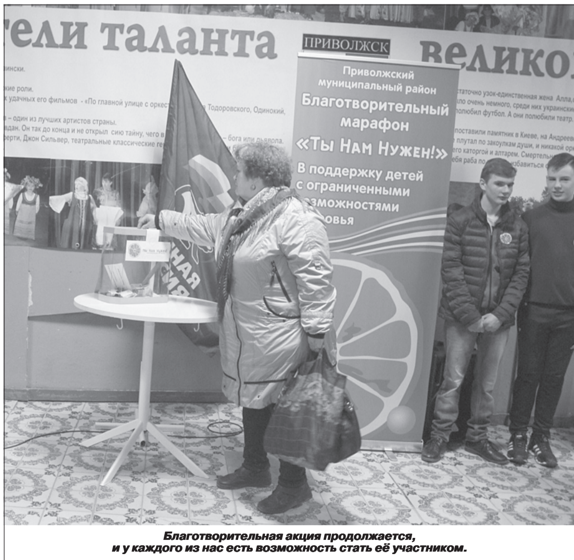
Благотворительная акция продолжается, и у каждого из нас есть возможность стать её участником.

P.S. О других мероприятиях в рамках акции наша газета будет постоянно информировать читателей.