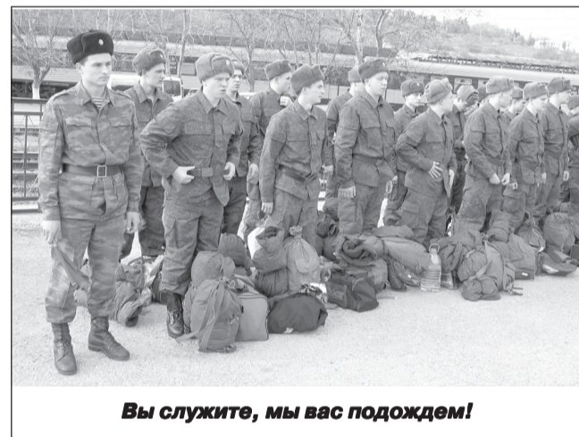
Вы служите, мы вас подождем!

Обучение проходит в Общероссийской общественной организации «Добровольное общество содействия армии, авиации и флоту России» на базе ОТШ ДОСААФ в г. Иваново. По окончании подготовки