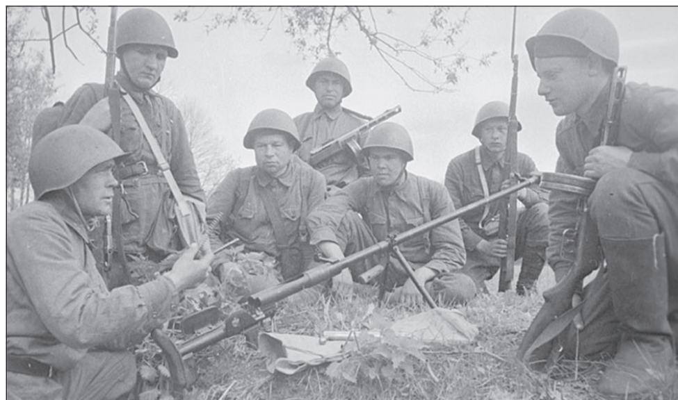
Передышка перед боем.