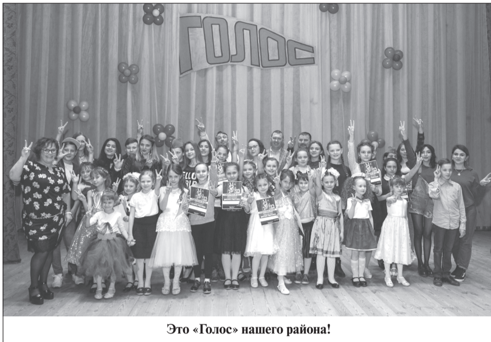
Это «Голос» нашего района!